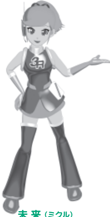
未来(ミクル) 印西クリーンセンター 3Rイメージキャラクター