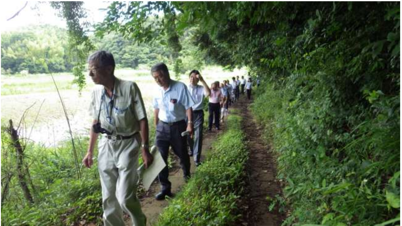
建設候補地北西側の谷津田や周辺の斜面林を確認しながら移動する地域振興策検討委員