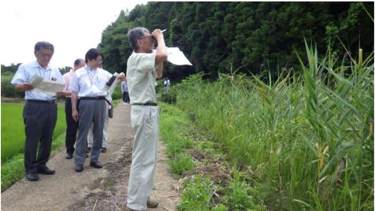
建設候補地西側の谷津田や猛禽類の飛翔が確認されている対岸の斜面林を 確認する地域振興策検討委員