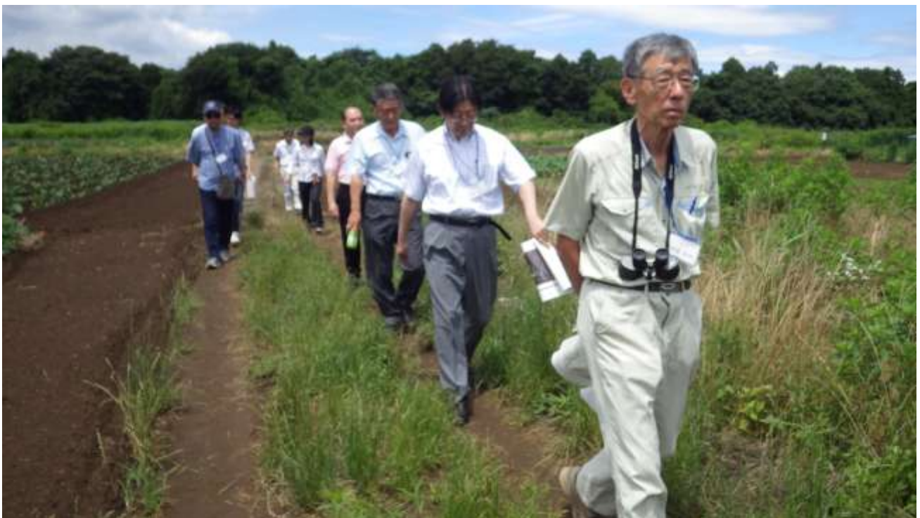
建設候補地東側に隣接する周辺状況を確認する地域振興策検討委員