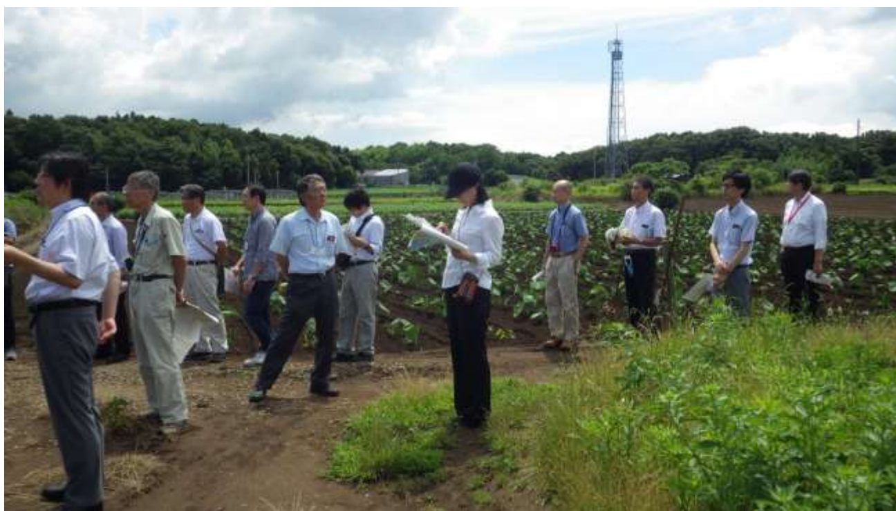
建設候補地南側の敷地境界から現地を確認する地域振興策検討委員