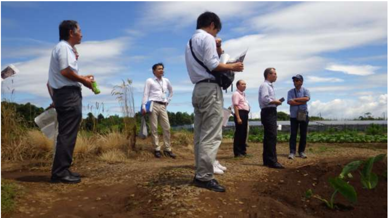
建設候補地南側の敷地境界から周辺の広大な大地を確認する地域振興策検討委員