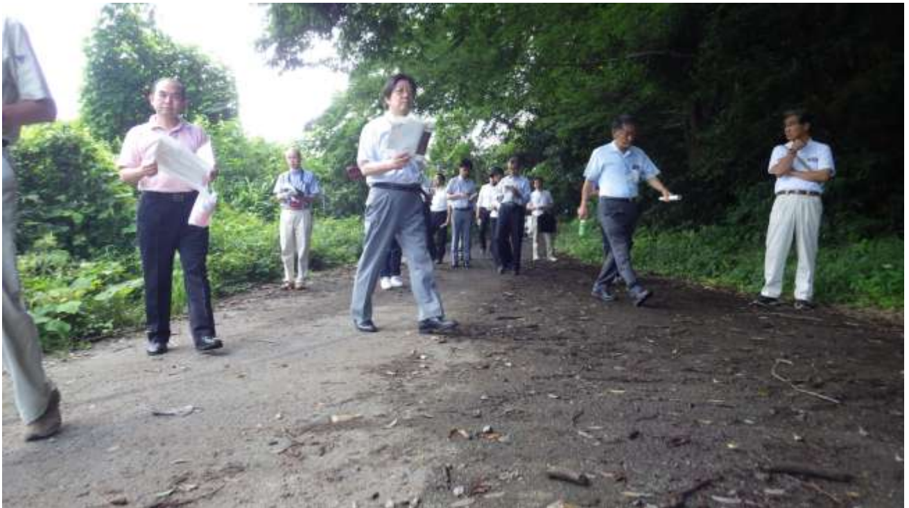
建設候補地北東側から周辺施設（泉カントリー倶楽部）や谷津田を確認する 地域振興策検討委員