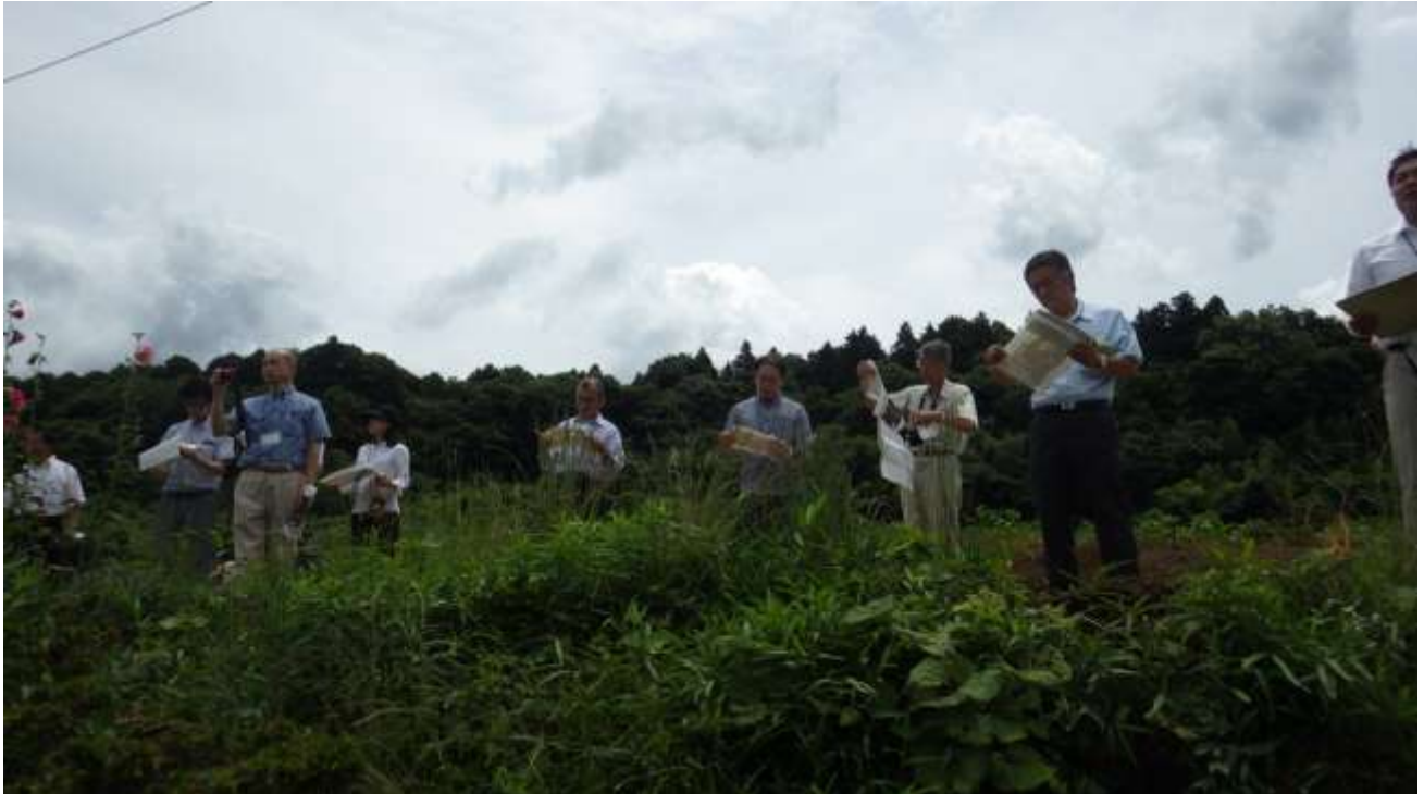
建設候補地北西側から印西市の計画幹線道路【（仮称）松崎・吉田線】を確認する地域振興策検討委員